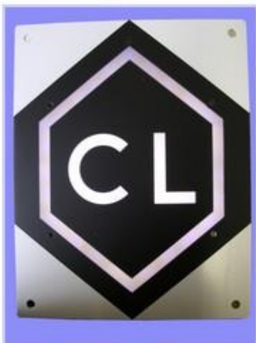
Panneau signalant le Comble Lacune

Un automate gère les informations délivrées par les différents capteurs, et commande en fonction de la situation le repliement ou le déploiement du comble lacune et de ses parties mobiles.