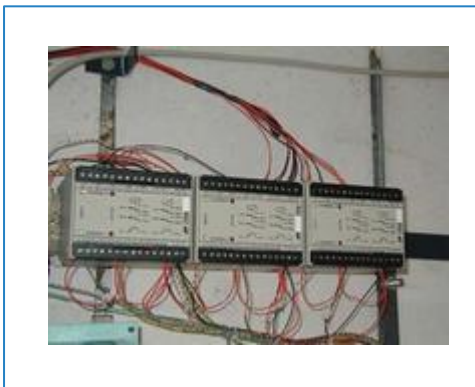
■ Exemple de Montage